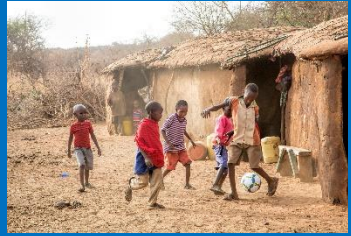
Community en dorp KidsGames