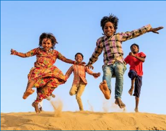
In de woestijn