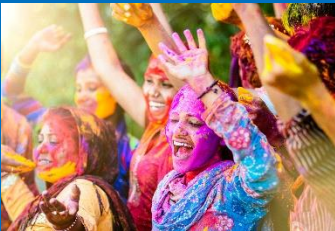
Viering verbonden met de seizoenskalender