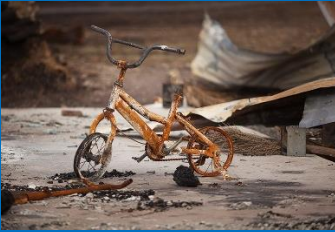
Reactie op een natuurramp

Jouw KidsGames kunnen vergelijkbaar zijn met een van deze ... of ze kunnen volledig verschillend zijn.