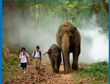
In de jungle