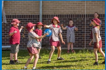
Uitbreidende activiteit voor een moedergroep