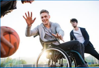
Kids Sport Competitie