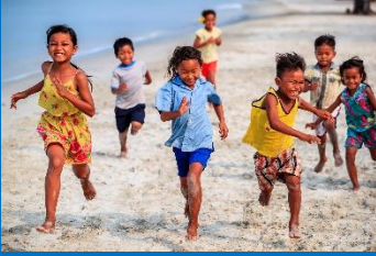
Verbonden met een wereldkampioenschap