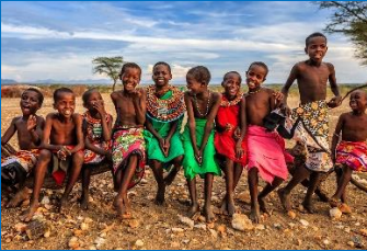
Kids Vakantie Kamp