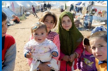
Ondersteuning van een vluchtelingenkamp