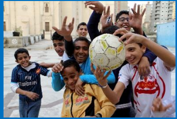
In een drukke stad