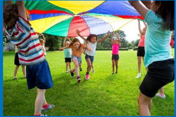
Zaterdagmorgen in een lokaal park